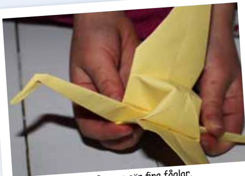
Flinka fingrar gör fina fåglar.