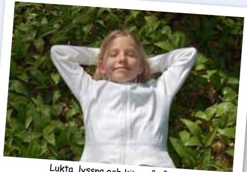
Lukta, lyssna och känn på våren!

Naturum Vattenriket ligger mitt i det nya naturreservatet Årummet. Under dagen upptäcker vi Årummet på flera olika sätt. Det blir guidade rundor, tipspromenader, turer med familjekanot och mycket annat. Kristianstads Radioamatörer finns också på plats och anropar världen från Årummet. Var med och upptäck vårt stadsnära naturreservat!