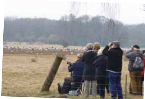
Se tranorna på nära håll vid Pulken.

Vi hälsar rullstolsburna och äldre särskilt välkomna och ser till att det finns plats till er i tornet. Ange adressen Pulken, Härnestsadvägen 155, om du kommer med färdtjänst.