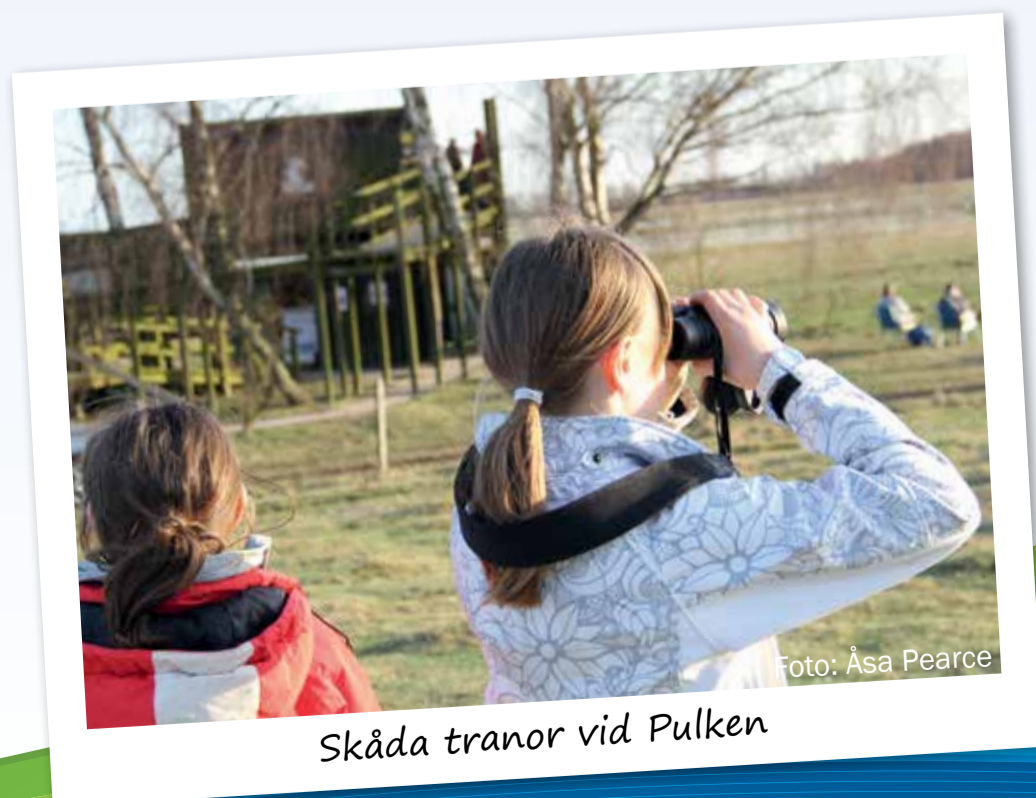
Skåda tranor vid Pulken