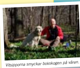
Vitsipporna smyckar bokslogen på våren.