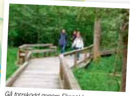
Gå torrskodd genom Ekenabbens sumpskog.