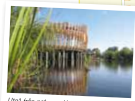
Utgå från naturum Vattenriket.