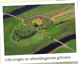
Lillö omges av strandängarnas grönska.