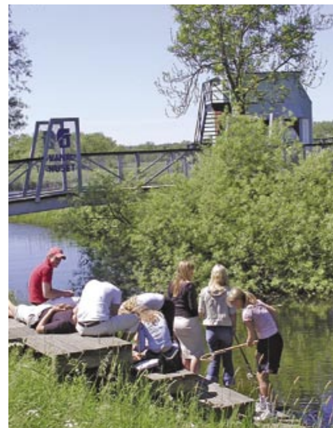
Utemuseum Kanalhuset, ute i vassen vid Helge å, men ändå bara 300 meter från järnvägsstationen i Kristianstad, är en bra startpunkt för att utforska Vattenriket. Här har också Naturskolan ett av sina uteklassrum.

En levande hemsida, med dagsaktuella rapporter kring vattenstånd, webbkameror eller information om storkar eller rastande tranor är en viktig del i stödfunktionen.