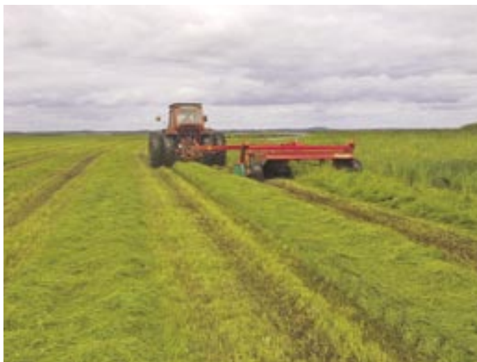
Slätter av våtmarksgräs på strandängar i Kristianstads Vattenrike.

Det gäller att skapa utveckling som inte tär på naturkapitalet utan istället får det att växa.