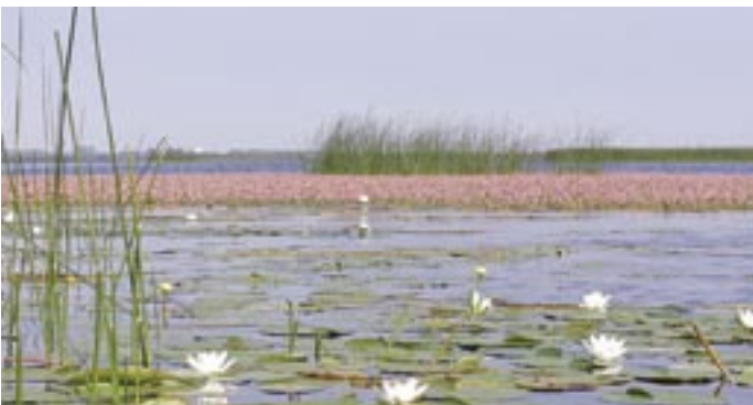
Vattenpilört och näckrosor pryder på många ställen Hammarsjöns yta, men här finns också sällsynta undervattensväxter, bland annat sjönajas.

En bred samverkan är viktig för alla parter.