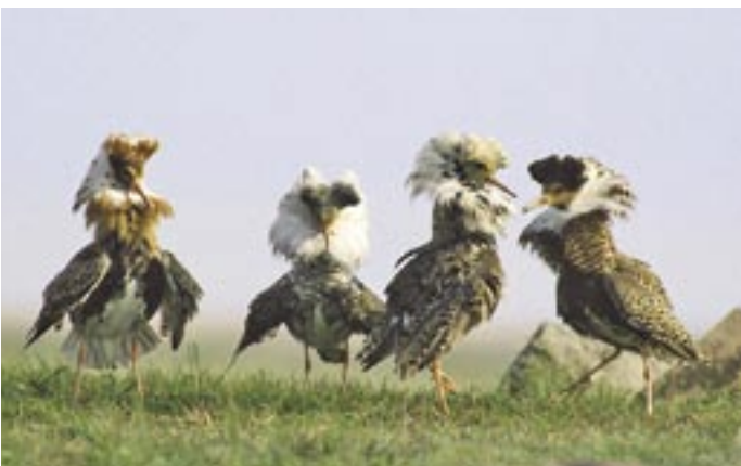
På strandängarna i Vattenriket kan man varje vår få se brushanespel på Håslövs ängar.

Men framförallt handlar det om att bevara värdena i landskapet och ekosystemen genom att arbeta tillsammans med lantbrukarna som sköter slätterängarna, betesmarkerna eller de sandliga odlingsmarkerna.